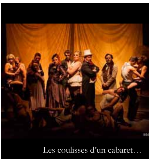
Les coulisses d'un cabaret...