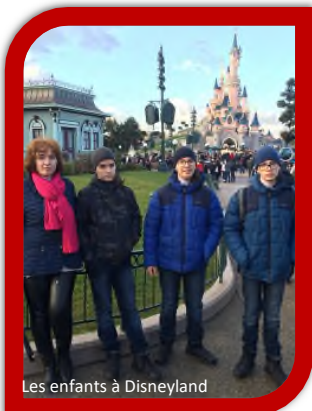
Les enfants à Disneyland

Accueillis dans les familles, les enfants découvrent les attraits de la région parisienne : Disneyland, Notre-Dame, Versailles, Montmartre ou encore les grands musées tel le Louvre.