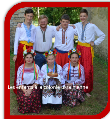
Les enfants à la colonie ukrainienne

Certains ont eu la possibilité de visiter Dijon ou Strasbourg, grâce à la prise en charge de la communauté ukrainienne de France.