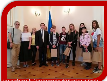
Les enfants à l'Ambassade d'Ukraine à Paris

Les familles bénévoles accueillent une demi-douzaine d'enfants au mois de juillet pour leur faire visiter Paris et Disneyland.