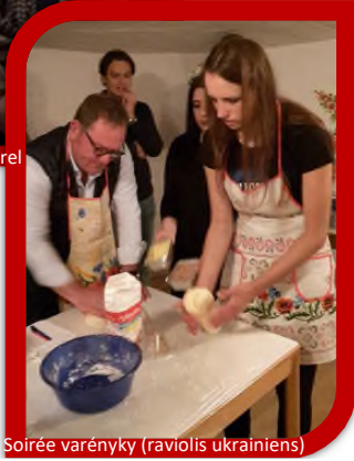
Soirée varényky (raviolis ukrainiens)

Des soirées, des dîners, des concerts ou des cours de cuisine ukrainienne sont organisés pour financer les envois de colis et les séjours des enfants en France.