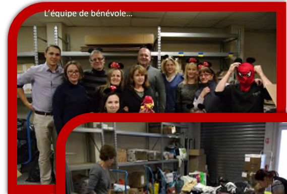
L'équipe de bénévoles...

Des vêtements sont collectés toute l'année par les bénévoles, triés par tailles et envoyés aux familles par colis à leur adresse.